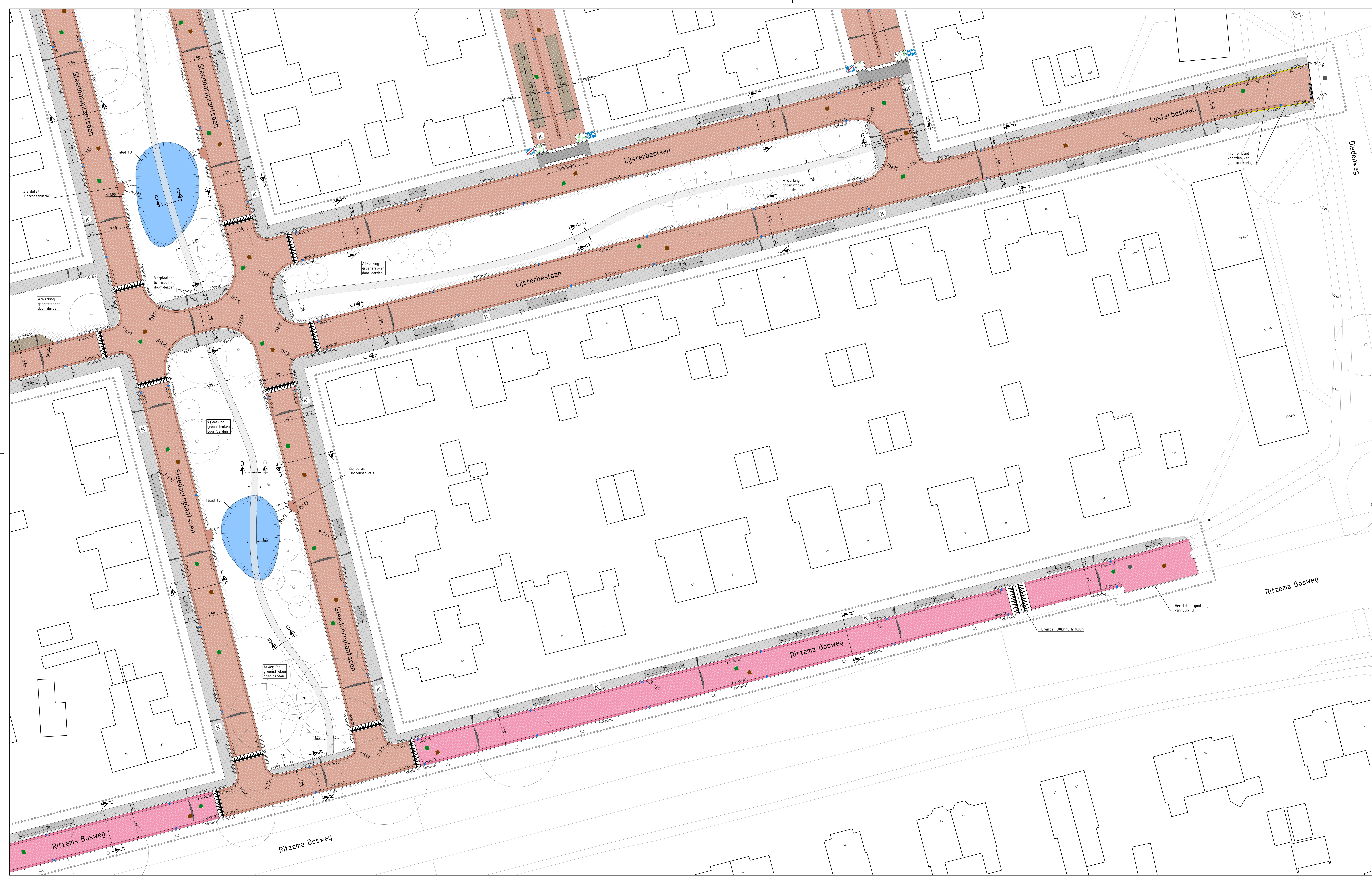
Overzichtstekening Nieuwe situatie Schaal 1:200