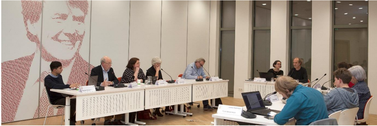
Rondetafelgesprek tijdens de Politieke Avond van 16 april 2018