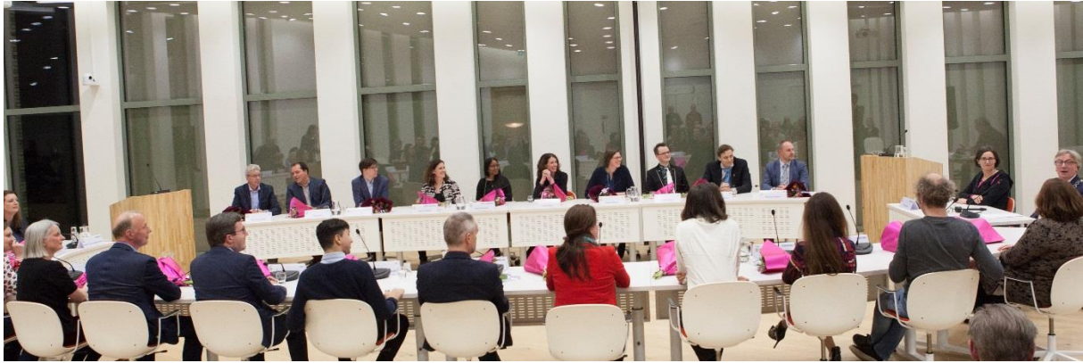
De nieuw benoemde raadsleden in de installatievergadering

De raad vergadert aan de hand van voorstellen. Bijna altijd komen deze voorstellen van het college, soms van bijvoorbeeld het Presidium of een individueel raadslid (initiatiefvoorstel). Over de voorstellen wordt besloten in de raadsvergadering. Voorstellen worden doorgaans voorbesproken in rondetafel- en opiniegesprekken. In de rondetafelgesprekken vindt het overleg met de burgers en andere betrokkenen plaats, maar ook met de portefeuillehouder. Debat over de onderwerpen vindt plaats in opiniegesprekken. Over amendementen en moties bij voorstellen wordt in de raadsvergadering gedebatteerd. Met een amendement wijzigt het raadsbesluit (ten opzichte van het door het college voorgestelde besluit). Een motie is bedoeld om de raad een gevoel uit te laten spreken en het college aan te zetten om een actie uit te voeren. Een motie kan bij een agendapunt worden ingediend maar kan ook gaan over een onderwerp dat niet staat geagendeerd.