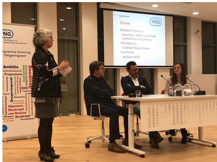
Avondsymposium democratie en omgevingswet