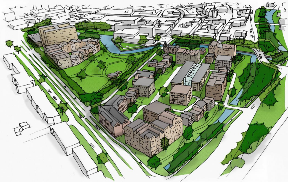
4. Parkmodel 09/06/16